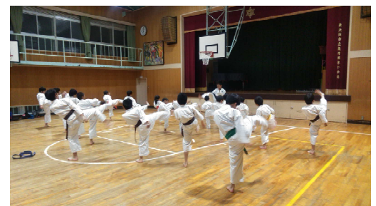
文武両道で成長するリーダーたち