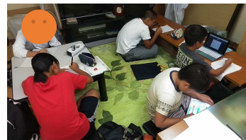
生野研究室で学ぶ生徒たち